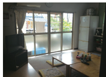
食堂兼共有スペース